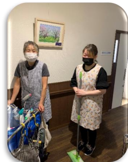
クリーン スタッフ