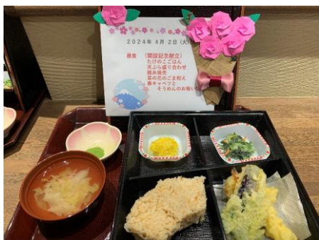
開設記念献立 たけのこ飯